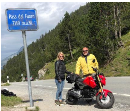
Passo del Forno

Resoconto: sveglia alle 0730 e colazione, ci si prepara per partire in moto verso il passo del Forno ma, alle 0845, inizia a piovere. Si aspetta che cessa. Ore 1030 si parte alla volta di Glorenza. Si supera il passo del Forno (2149 m). Pranzo al ristorante Steinbock poi visita della cittadina medioevale. Molto bella, particolare, racchiusa da mura. Al ritorno verso Zernez visita di Müstair e della suo famoso convento di San Giovanni Battista (Patrimonio Unesco). La visita guidata ci da preziose informazioni sulla storia sua e della regione. Entrata fr. 12.-.