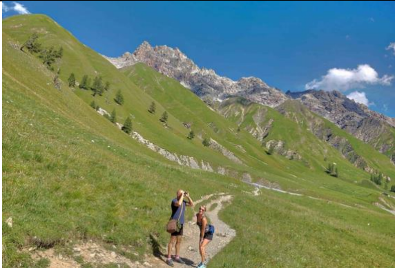
Alpe di Trupchun

Verso le 1300 con la moto raggiungiamo il parcheggio a S-chanf (12 km da Zernez) e da lì a piedi ci addentriamo nel parco nazionale in zona Trupchun per un percorso di 13 km. Possiamo vedere da distanza molto ravvicinata marmotte ed una coppia di cervi.