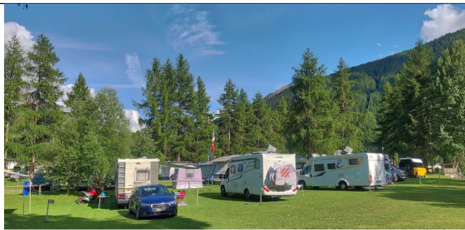
Zernez camping Cul

Resoconto: alle 1000 partiamo da Maloja alla volta di Zernez. Ci sistemiamo al camping Cul che occupa un'area molto estesa a ridosso del fiume Inn. Nel pomeriggio visita al centro cittadino.