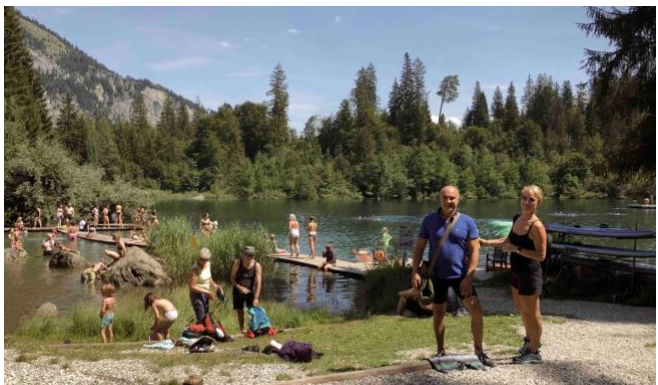
Lago di Cresta