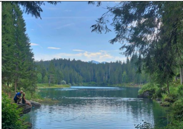
Lago di Cauma

Resoconto: camminata di 12,5 Km tra i vari laghi di Flims, tra i quali il Cauma ed il Cresta. Con pausa pranzo picnic impiegato 4 ore e mezza. Sentiero facile, dislivelli limitati.