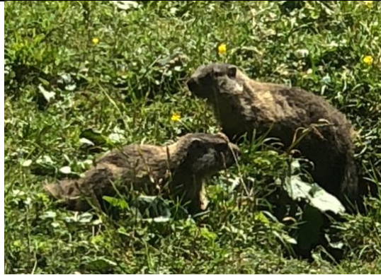
Una coppia di marmotte